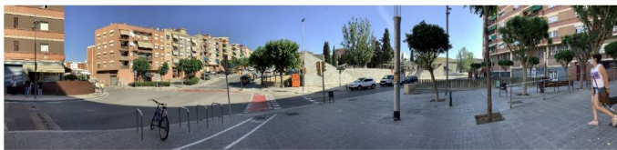
Rotonda pla de barris . Carril bici en voreja