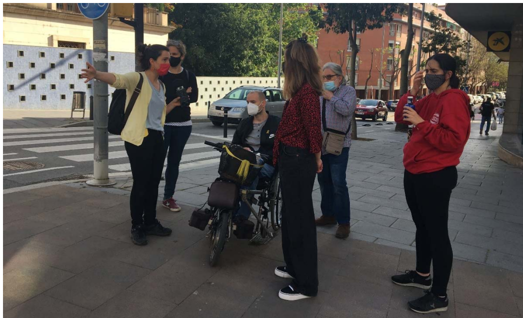
Fig 01. Propostes veïnals a peu de carrer, a l'àmbit 2 del procés participat