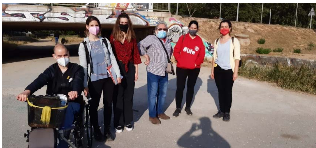
Fig 02. Veïnes i veïns participants de la Passejada a l'àmbit 2.