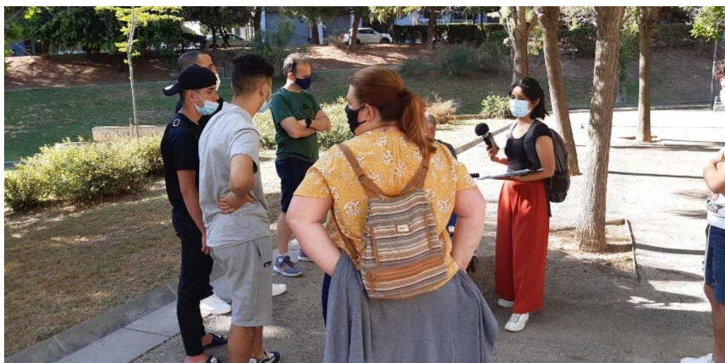
Fig 01. Propostes veïnals a peu de carrer, a l'àmbit 3 del procés participat