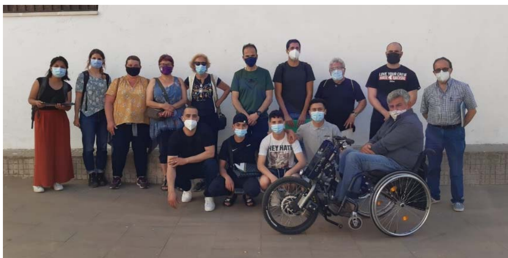
Fig 02. Veïnes i veïns participants de la Passejada a l'àmbit 3.