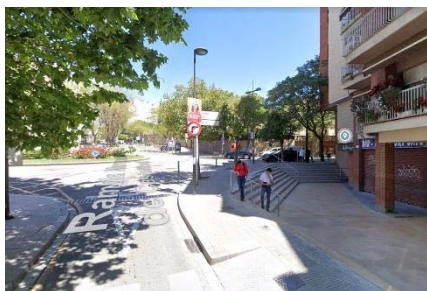
11. Pas sota vies C/Verge de Montserrat